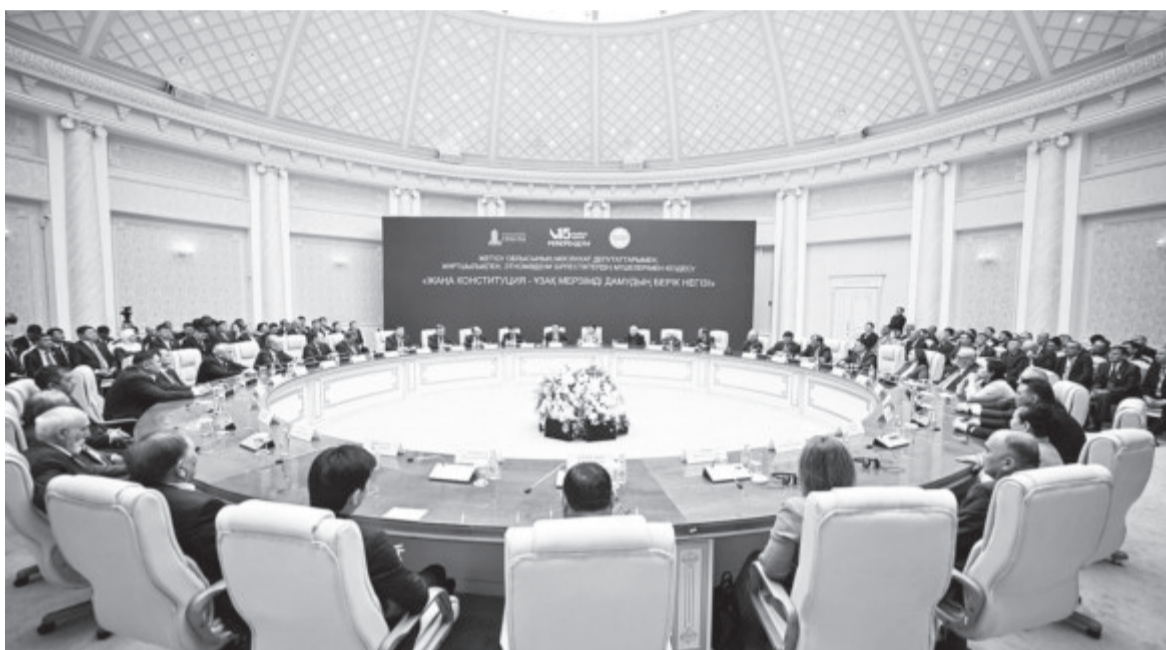
қорғауға, сондай-ақ, елдің орнықты дамуына басымдық берілген», – деді Мәулен Әшімбаев. Сонымен қатар Сенат Төрағасы жаһандық сын - қатерлер мен халықаралық тұрақсыздық белең алған қазіргі кезеңде мемлекеттің құқықтық негіздерін жаңғыртудың маңызы арта түскеніне на-

«Жаңа Конституция жобасына байланысты республикалық референдум – Президентіміз Қасым-Жомарт Кемелұлы Тоқаевтың елді ауқымды әрі жүйелі жаңғырту бағдарын іске асыру жолындағы тарихи кезең. Еліміздің болашағына қатысты маңызды шешімдерді азаматтардың таңдауына сүйене отырып қабылдау демократия қағидаттарына адалдықтың айқын көрінісі екені анық. Конституциялық реформаның басым міндеті – Тәуелсіздікті нығайту және азаматтардың әлауқатын арттыру. Осыған байланысты жаңа Конституция жобасында заң үстемдігі мен құқықтық тәртіпті күшейтуге, азаматтардың құқықтары мен мүдделерін