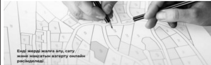
Енді жерді жалға алу, сату және мақсатын өзгерту онлайн рәсімделеді

2026 жылдың қаңтарынан бастап Қазақстанда жер қатынастары саласындағы үш қызмет цифрлық форматқа көшті. «Азаматтарға арналған үкімет» Мемлекеттік корпорациясының хабарлауынша, енді жердің нысаналы мақсатын өзгерту, жалдау мерзімін ұзарту және жер учаскесін сатып алу қызметтерін онлайн алуға болады.