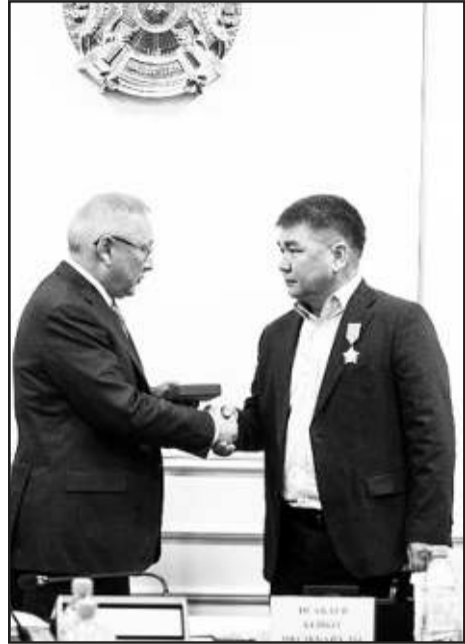
шаруашылығын дамытуға елеулі үлес қосып жүр.

Сол сияқты «Асыл тұяқ» ЖШС асыл тұқымды ірі қара мен қой өсіріп, малдың жаңа тұқымдарын шығарады. Сөйтіп, экспорттық әлеуетін арттырып, етті мал