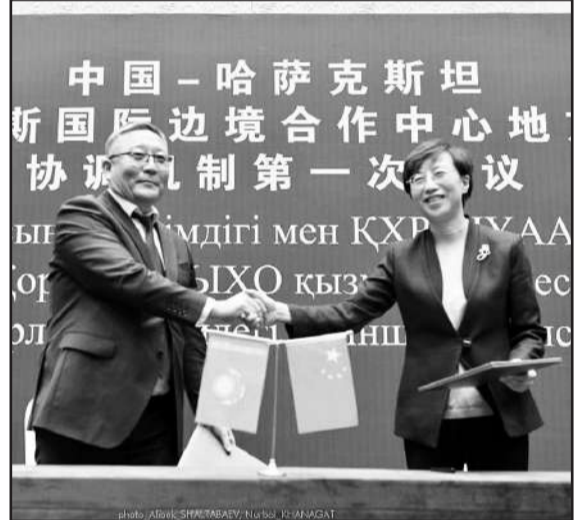
Мәдени-туристік, ғылыми-техникалық, сол сияқты ауыл шаруашылығы бағытындағы байланыстарды тереңдету түсетініне сенім білдірді.

Сондай-ақ, жиын соңында екі мемлекет басшыларының бірлескен бастамаларының лайықты іске асырылуына бар күш-жігерлерін салатынын айтқан қос тарап бұл кездесу екі жақты сауда-экономикалық,