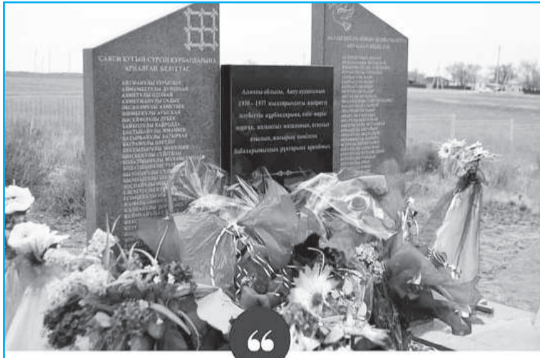
Сағабүйен ауылында "Қуғын-сүргін құрбандарына" арналған белгітас ашылды.