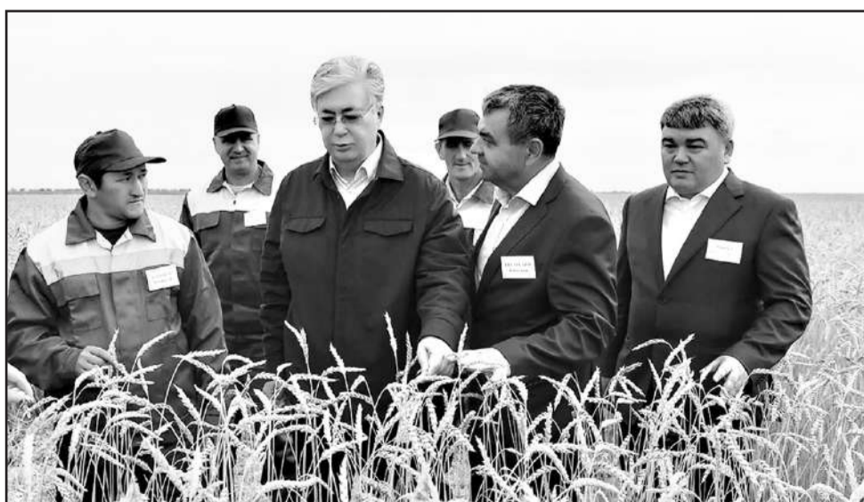
Біріншіден, қазақ тілінде сөйлеу мақтанш болуы үшін қоғамда оған деген қажеттілікті арттырған жөн. Мемлекеттік қызметке, оның ішінде, халықпен тығыз жұмыс істейтін лауазымға тағайындау

Әрине, мұндай жағдайдың мүлде болмағаны жақсы. Сондықтан зиялы қауым өкілдері болашақ өмір туралы мәселені қазірден ой таразысына сала беруге тиіс.