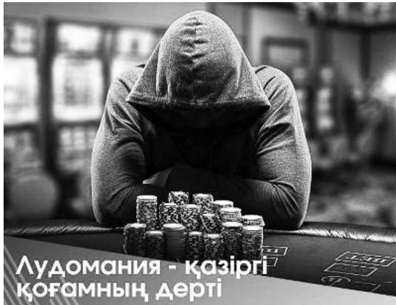
Лудомания - қазіргі қоғамның дерті

шығып, санының көбеюі жастарды тура жолдан адастыруға бірден - бір себеп.