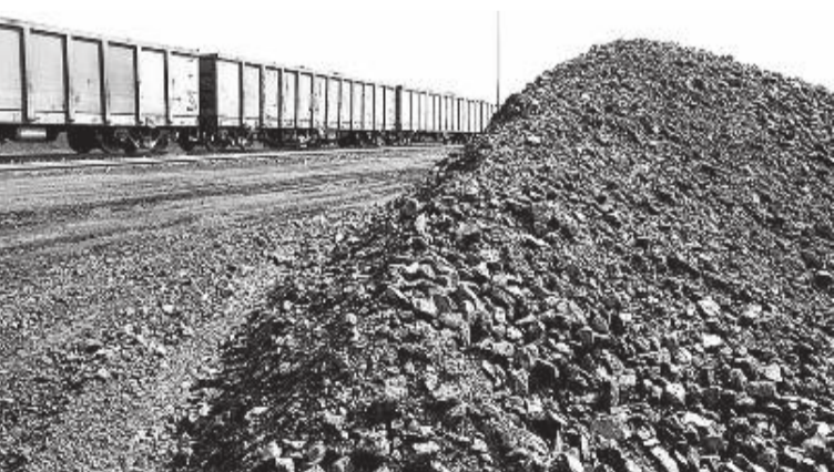
Құрметті Ақсу ауданының тұрғындары! Алдағы 2024 - 2025 жылдың қыс мезгілінің ерте түсуіне байланысты

жылыту маусымына дайындық шараларын жүргізу аясында, күз айларында жылу беру кәсіпорындарына көмірді жеткізу жұмыстары атқарылады, ол коммуналды - тұрмыстық көмірді тасымалдаушы вагондар санының, қысқаруына әкеп соғады. Осыған орай, жылыту маусымында көмірдің, жетіспеушілігін және әлеуметтік шиеленісті болдырмау мақсатында, Ақсу ауданының әкімдігі қатты отынның қажетті мөлшерін көмір тұйықтары мен қоймаларынан алдын - ала жаз - күз мезгілінде сатып алу керектігін ескертеді.