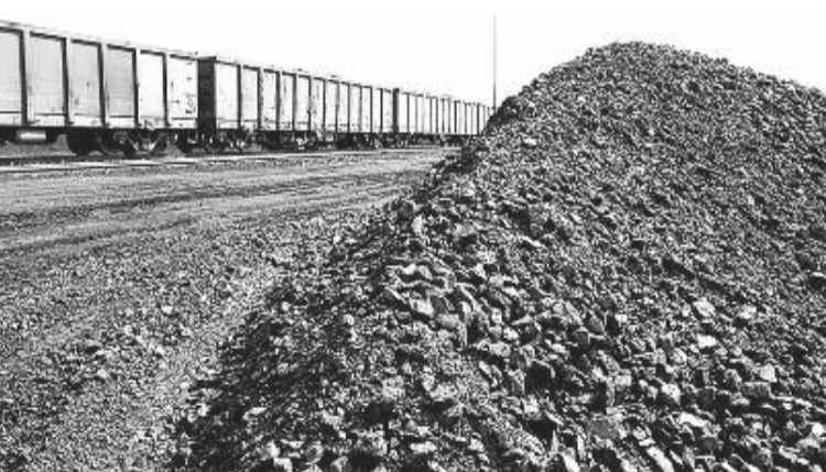
Құрметті Ақсу ауданының тұрғындары! Алдағы 2024 - 2025 жылдың қыс мезгілінің ерте түсуіне байланысты

жылыту маусымына дайындық шараларын жүргізу аясында, күз айларында жылу беру кәсіпорындарына көмірді жеткізу жұмыстары атқарылады, ол коммуналды - тұрмыстық көмірді тасымалдаушы вагондар санының, қысқаруына әкел соғады. Осыған орай, жылыту маусымында көмірдің, жетіспеушілігін және әлеуметтік шиеленісті болдырмау мақсатында, Ақсу ауданының әкімдігі қатты отынның қажетті мөлшерін көмір тұйықтары мен қоймаларынан алдын - ала жаз - күз мезгілінде сатып алу керектігін ескертеді.