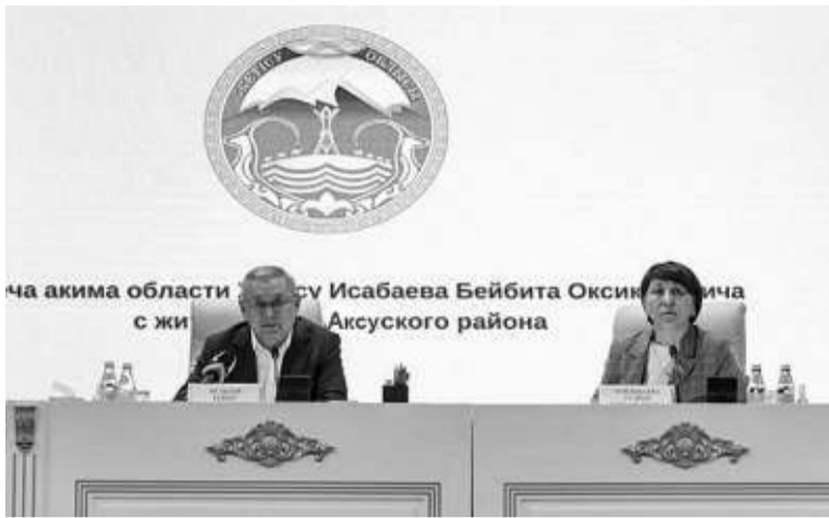
Ақсу облысының әкімі Б.Ө.Исабаевтың аудан халқымен кездесуінен. Суретте: Ақсу облысының әкімі Б.Ө.Исабаев, Ақсу ауданының әкімі Бейбита Оксик, Ақсу аудандық әкімдігінің басшысы Аманжол Аманжолұлы.

Зауыт Ақсу ауданымен қатар, көршілес Алакөл, Сарқан аудандарының шаруашылықтарынан қант қызылшасын қабылдайды. Биыл бұл аудандар қант