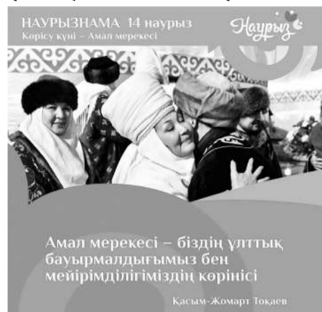
Амал мерекесі – біздің ұлттық бауырмалдығымыз бен мейірімділігіміздің көрінісі