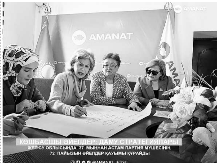
КӨШБАСШЫ ӘЙЕЛДЕР: ДАМУ СТРАТЕГИЯЛАРЫ ЖЕТІСУ ОБЛЫСЫНДА 37 МЫҢНАН АСТАМ ПАРТИЯ МҮШЕСІНІҢ 72 ПАЙЫЗЫН ӘЙЕЛДЕР ҚАУИМЫ ҚҰРАЙДЫ